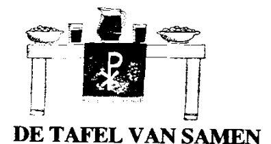
DE TAFEL VAN SAMEN

Wanneer we Avondmaal vieren, delen we brood en we delen wijn of druivensap. Waarom eigenlijk? Waarom brood, waarom wijn? Wat hebben die te maken met Jezus, want aan Jezus denken we toch bij het Avondmaal? Om elkaar te helpen bij deze vragen, vertel ik hier eerst iets over wijn. En ik sta stil bij Jezus die wijn in verband brengt met het bloed van zijn lichaam.